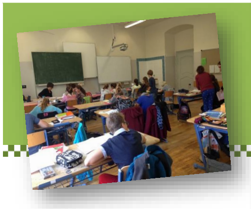
GTK-Konzept-Stundenplan für 2. Klassen