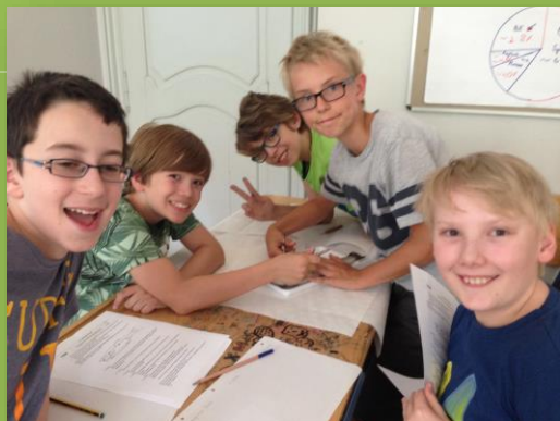
Konzeptstundenplan ab 2013/14