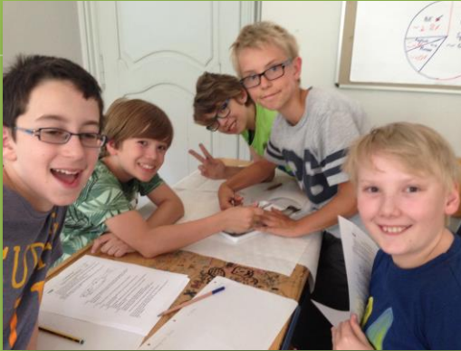
Konzeptstundenplan ab 2013/14