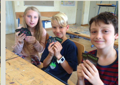
„Spielen macht Sinn“